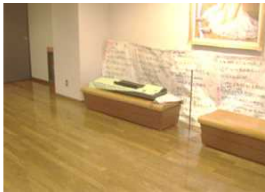
2Fエレベーターホール 各練習場所には合唱練習用のキーボードがあります