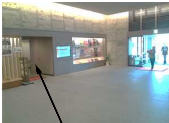
小ホールに向かう階段はこちらから