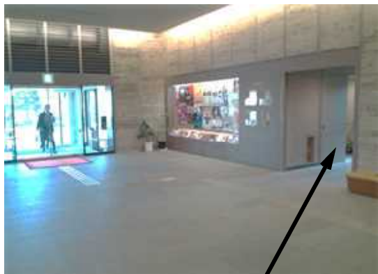
練習室1~3に向かう階段はこちらから