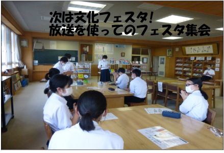
次は文化フェスタ! 放送を使ってのフェスタ集会

二学期になり、これまで制限されていた様々な活動が再開されました。先日は、二天行事の一つであるスポーツの祭典を無事成功させることができました。四中生全員で盛り上がり、各クラス、各学年、学校全体の団結を深めることができました。