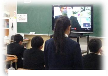
〈各教室で任命を受けました〉