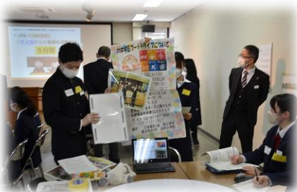
SDG s 活動の紹介