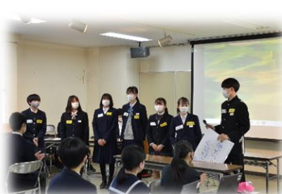
学校を越えて共同発表