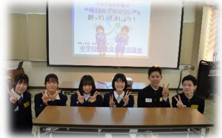
頑張った6名の参加者