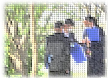
Aさんのワークシート