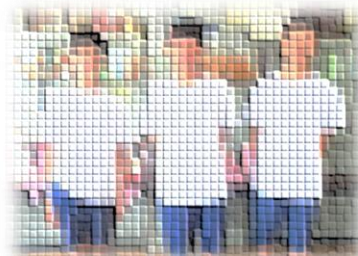
ベストを尽くせ! 新体操 硬式テニス 陸上