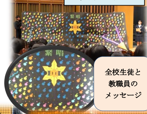
全校生徒と 教職員の メッセージ