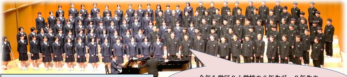
R5,10,18 希望ホール「3学年 大地讃頌」