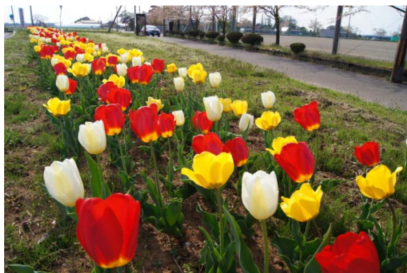
＜手蔵田地区「人和夢実行委員会」から ご指導いただいた学校前花壇＞

学校統合から1年が過ぎました。昨年の今頃は新しいこと、初めてのことに尽くして、立ち止まることを許されないかのような日々でした。様々な課題に直面し、よりよい答えを求めて試行錯誤を繰り返しながら、平田小学校の校風が徐々に築かれつつあります。