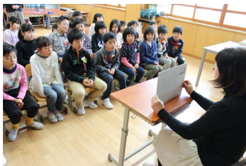
＜平田小読み聞かせ隊の活動＞