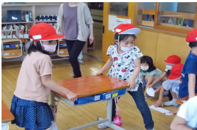
「うんしょ、えいしょ」1年生のそうじ練習。友だちと力を合わせると、そうじも楽しい！

どの答えにも共通するのは、「友だち」「みんなで」「仲間」などの「つながり」を表す言葉のようです。これこそが「学校の楽しさ」をそのまま表しているのですね。