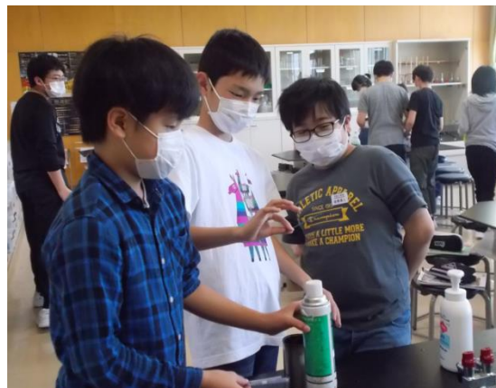
「ものが燃えるには、何が必要なのだろうか。」 チームで解決する楽しさを味わいます(6年生理科)