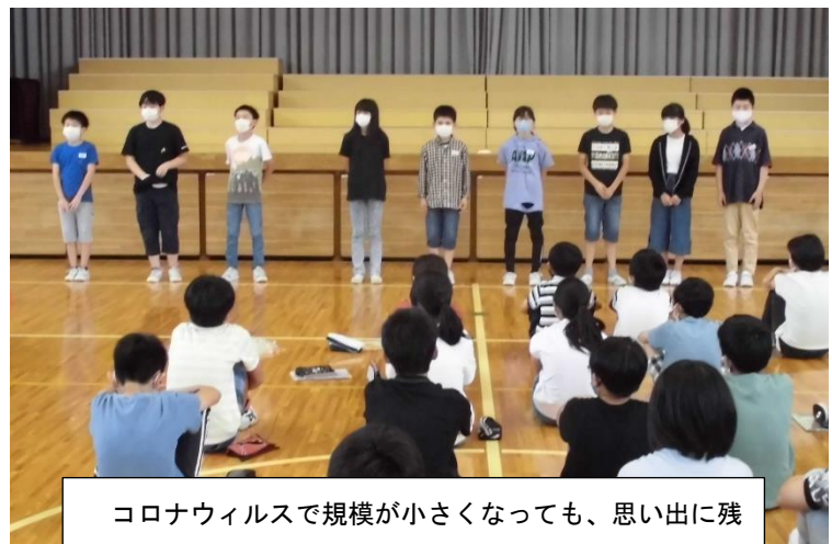
コロナウィルスで規模が小さくなくても、思い出に残る運動会にしようと、組活動が始まりました。