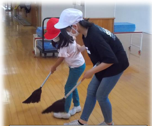
自分たちの場所を自分たちできれいにしようと、教え合います。（縦割清掃）

子ども達の本気度が高まるのは、「まかせられた」場面に多く見られます。「縦割り活動のリーダーとして下級生に教えなくては」、「チームで最強の答えを見つけ出そう」「力を合わせないと食事が完成しないぞ」など、自分たちでなんとかしていかねばならない状況に追い込まれるからこそ湧き出る意欲や責任感なのでしょうね。