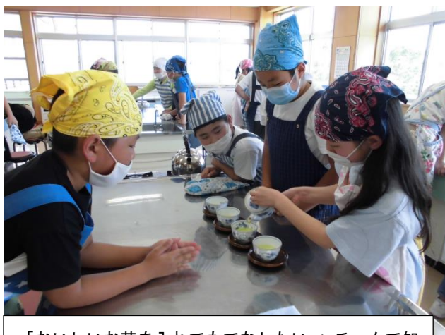
「おいしいお茶を入れてもてなしたい。」チームで知恵を出し合って、協力します。（5年家庭科）