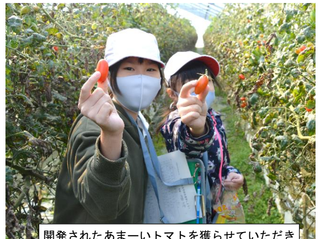
開発されたあまーいトマトを獲らせていただきます。