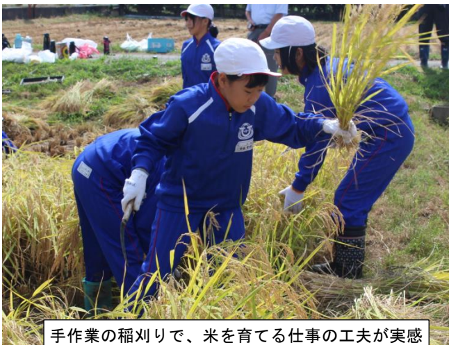
手作業の稲刈りで、米を育てる仕事の工夫が実感できます。

どんな仕事（職業）にも共通しているのが、「夢（願い）」と「試行錯誤」があるということです。小学校時代の学び方も、将来の願いを叶える練習になっているのでしょう。