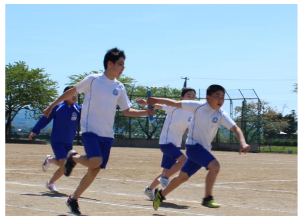
きれいで確実なフォームで、バトンを受け渡します。