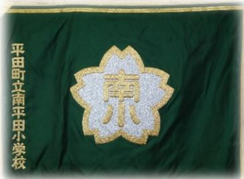
旧南平田小学校 校旗