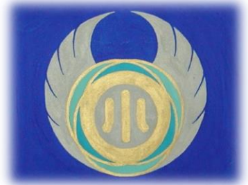
南平田小学校 校章

5月11日(水)、創立記念式を行いました。南平田小学校が東陽小学校と統合したのが平成18年4月1日ですので、17回目の創立記念日となります。創立記念式では、今年度より旧平田町の3つの小学校が1つの学校になった記念すべきこの機会に、全校児童に対し、旧平田町の3つの小学校の校旗を紹介し、3校の校章に込められた思いや願いを伝えた後、次のような話をしました。