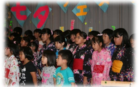
「マイ夢セタフェスタ」(7/5)で歌声を披露