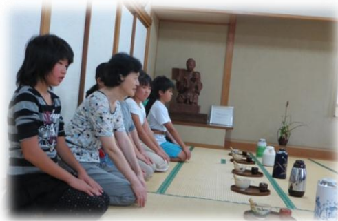
地域の方と一緒にクラブ活動(茶道)