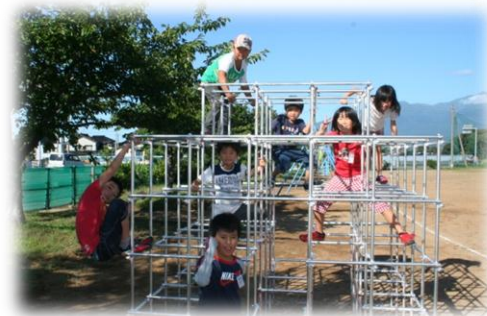
中学生がペンキを塗ってくれた遊具で遊ぶ 地区合同避難訓練(9/18)で万一の備え