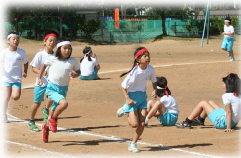
強風に負けず走りきった記録会(9/26)