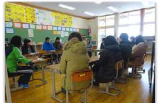
2月10日 学級懇談会 たくさんのご参加ありがとうございました。