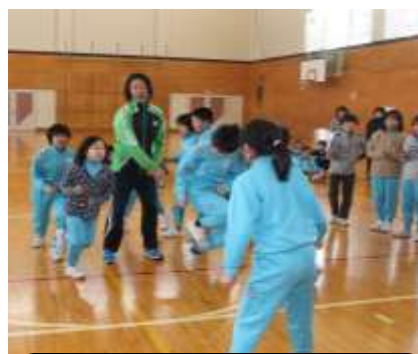
3年生 KKK賞 3分間 260回 (去年123回)

童話や昔話は、お話の中に入りこみ、なりきって想像する楽しさを味わうことができます。また、一話一話にメッセージや教えがありますね。大好きな家族の読み聞かせを通し、きっと子どもはお気に入りのお話や本と出会うことでしょう。さらに、読み聞かせには、子どもの心を安定させ、本の好きな子どもが育つよさがあると思います。布団の中で、抱っこしての読み聞かせは、今、この時期が、おすすめです。