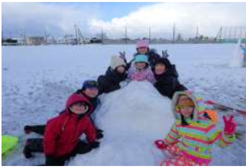
1月22日 雪となかよし