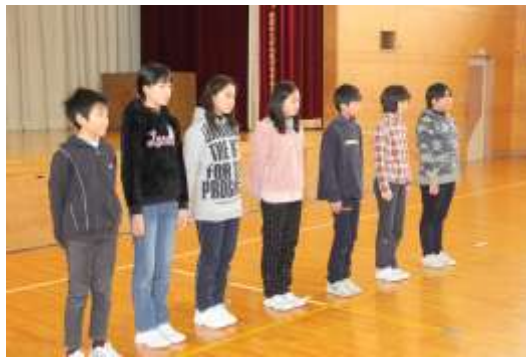
1月20日 6年 音読発表 暗記して堂々と発表 さすが!