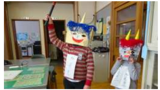
2月4日 元気に節分の豆まき