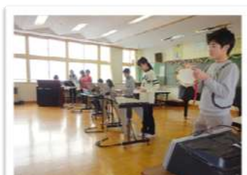
2月10日 授業参観 6年 感謝する会