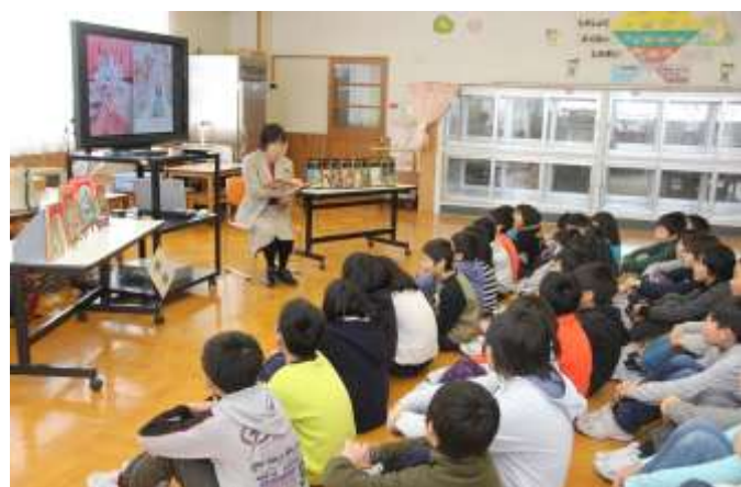
校長講話で読み聞かせ アンデルセン「はくちょうのおうじ」