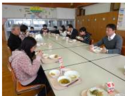
6年生と学校評議員との会食