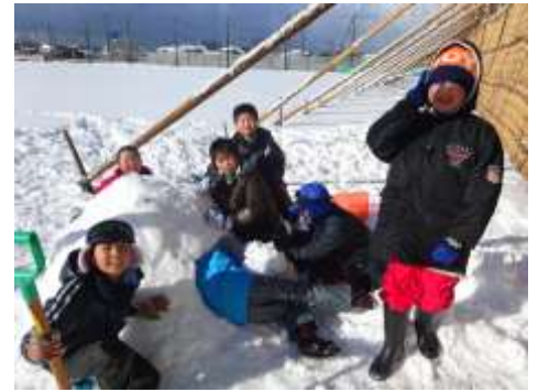
1月22日 雪を楽しもう