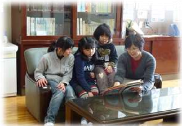
休み時間、校長室での読み聞かせ アンデルセン、アラビアンナイト等の童話 やアフリカの動物のお話を読んでいます。