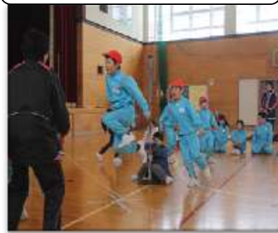
2年生 KKK賞 3分間 221回 (去年79回)