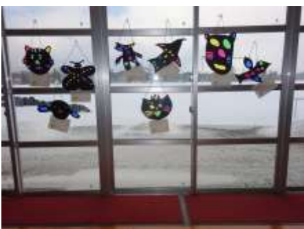
2年生の図工の作品が窓を飾ります。