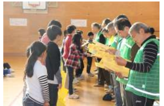
10月17日 見まもり会に感謝する会