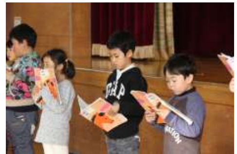
11月9日 1年 音読発表