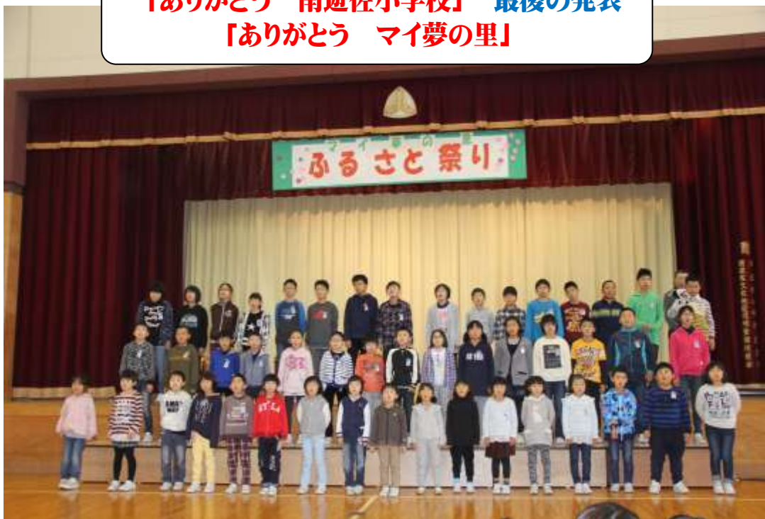
マイ夢の里ふるさと祭り 全校合唱 48人の「マイバラード」