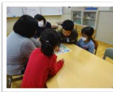
あおぞら・ひだまり学級