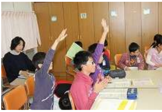
10月14日 マイ夢子ども議会