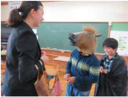
10月21日 5年生ハロウィン