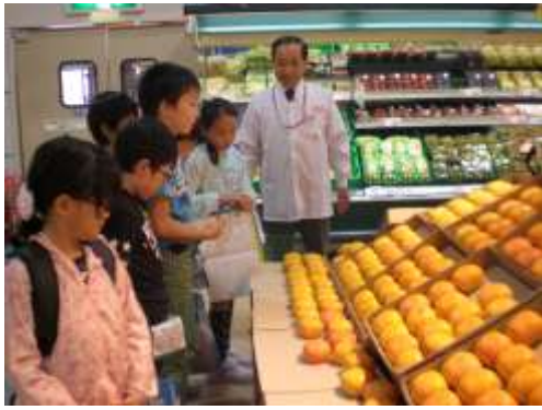
10月7日 3年 社会科見学