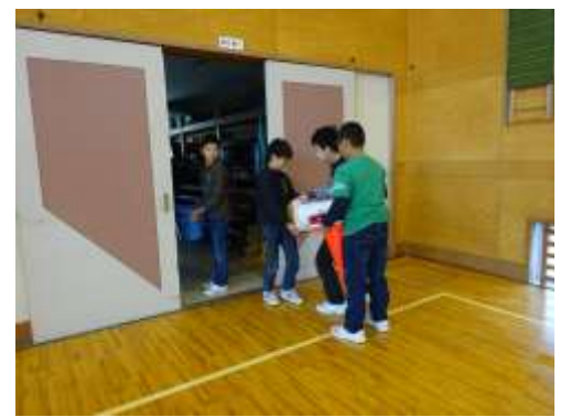
11月8・9日 5年生 おみごと!

「大変だ!」暴風雨で、雨漏りした体育館にバケツと雑巾、カラーコーンを準備してくれた5年生。次の朝、きちんと片付けまでしてくれました。ありがとう。自分達で考えた行動。すばらしいね。