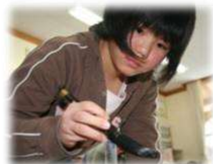
6年代表で市書き初め展に挑戦する6年生