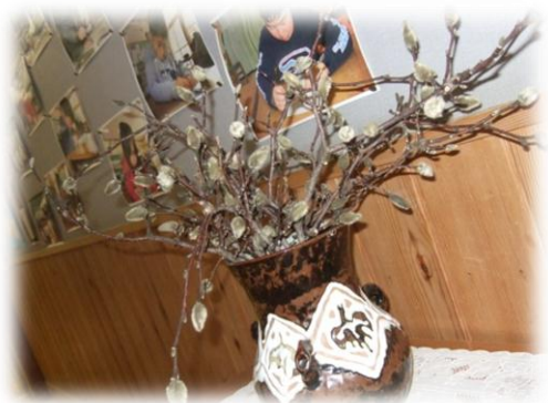
「あおぞら」さんが見つけたネコヤナギ