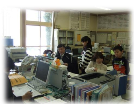
ある日の風景（担外も学習サポーター）