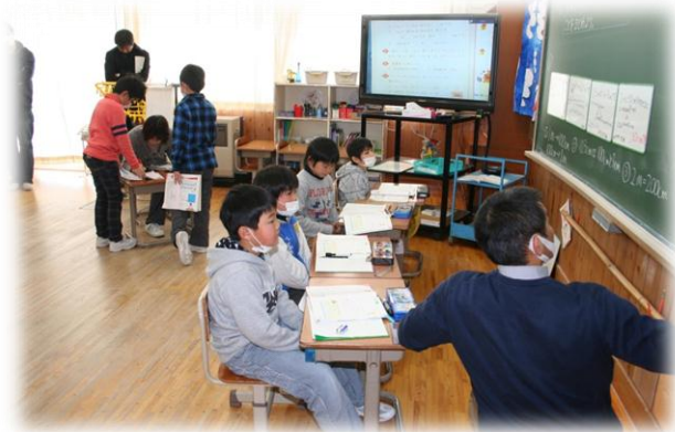
授業参観（2年生 算数）