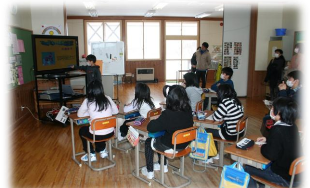
授業参観（5年生 国語）