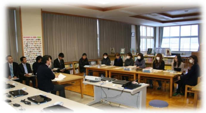
新入学保護者説明会