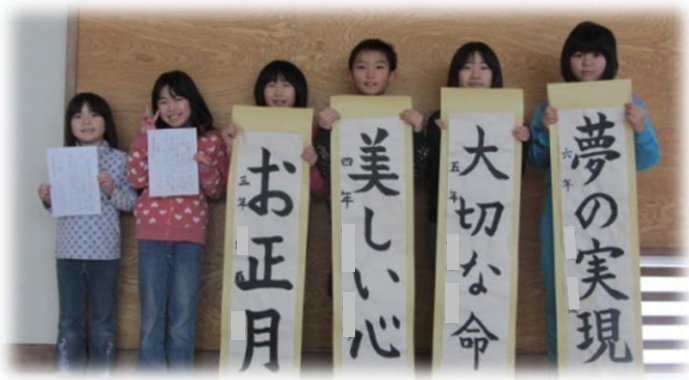
酒田市書き初め展 学校代表の力作