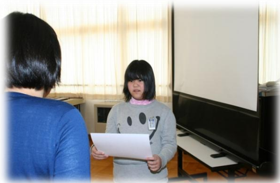
授業参観（4年生 1/2成人式）