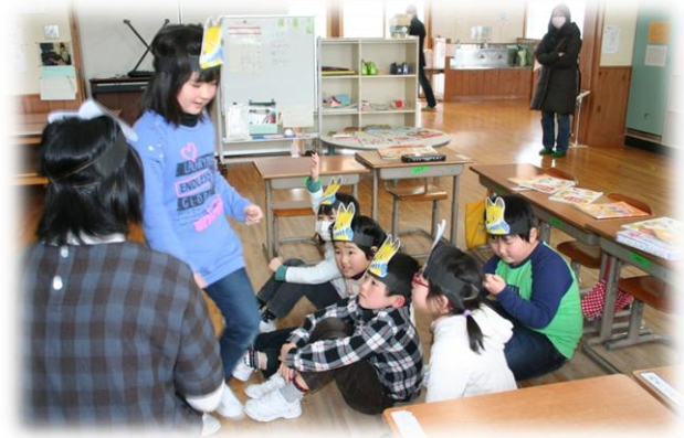
授業参観（1年生 道徳）