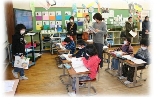
授業参観（3年生 算数）