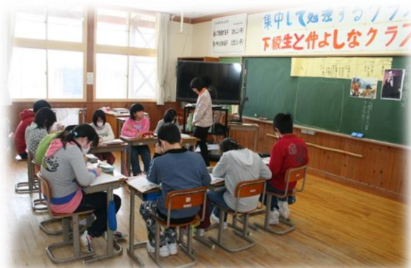
授業参観（6年生 国語）