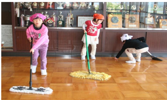
「今日は、モップできれいにするぞ！」(1年生)

時代が変わっても、「自校の誇り」としてこの伝統を子ども達と一緒に大切に守っていききたいと思ひます。