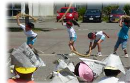
保育園児と菖蒲たたき