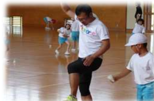
「運動・遊び」の外部指導者と