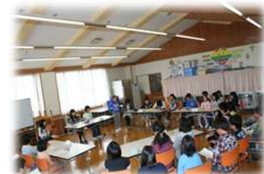
マイ夢子ども議会