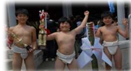
わんぱく相撲に出場選手 三人とも勝利をあげる大活躍! 優勝者は全国大会へ