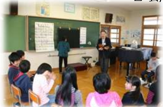
地域の先生とのクラブ