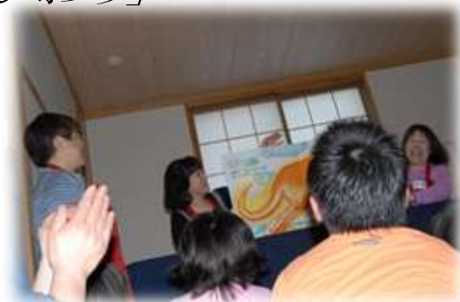
「やさしい畑」 読み聞かせ