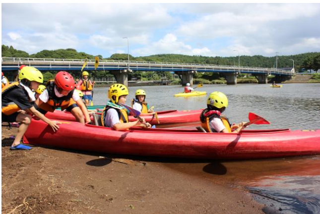
さあ、川へ出るぞ！自分の役割を精いっぱい、力を合わせて！

今月7日・8日に山形県海浜自然の家を拠点に、4・5年生の自然教室を実施しました。当初の予定は1泊2日でしたが、猛烈な暑さによる熱中症の心配があったことから、2日間日帰りで行いました。1日目は、青空広がり穏やかな風吹く絶好の状況下、牛渡川河口で「カヌー体験」。全員が上手にパドルを操作することができ、大自然を満喫しました。午後は松林の中で「ディスクゴルフ」。2日目は「川カヌーツーリング」の予定でしたが、風速6メートルの強風のため、断念。子ども達は気持ちを切り替えて、別メニューの「モルック」「ドミノ」「フィールドアスレチック」で大いに楽しむことができました。思い通りにいかないのが「自然」であることに気付くとともに、その中でできることを精一杯楽しむことを学びました。5年生と4年生が一つ一つの活動を通して、さらになかよくなり、励まし合い、協力し合うことで、これまで経験したことのない深い達成感と充実感を味わいました。