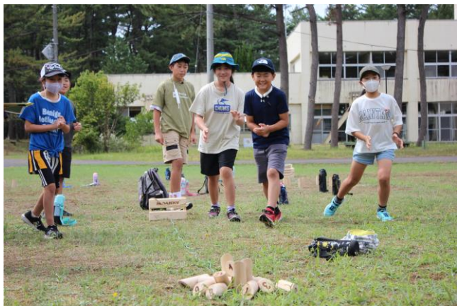
あのピンをねらって！よし、うまい！モルックで大盛り上がり！

10月、実りの秋に向かって、子ども達の活躍がますます楽しみです。そして11月3日は「学習発表会」です。