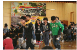
4月8日 入学式(火) 元気いっぱいの1年生