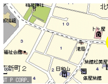
三叉路。一時停止が無く衝突する危険あり。ブロック塀が高く、左方からの車等が低学年の子供には見づらい。