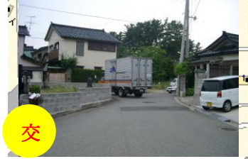
法音階保育園前の通り。朝夕の送迎時間帯は車が込み合い危険。