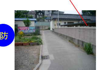
カーブで見通しが悪い坂道。時々逆走してくる車があるので自転車で通る時注意。