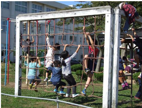
<なかよし班で遊ぶロング屋休み>