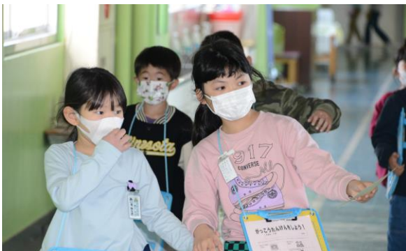
「ここはしずかに歩こうね」学校探検で、1年生に教える2年生のたのしいこと。