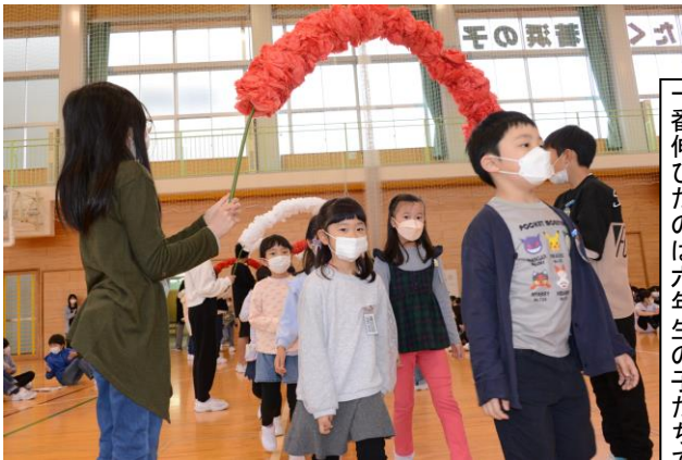
一年生を迎える会を任せられて一番伸びたのは六年生の子たちです

子ども達の本気度が高まるのは、「まかせられた」場面に多く見られます。「縦割り活動のリーダーとして下級生に教えなくては」、「チームで最強の答えを見つけ出そう」「力を合わせないと1年生を迎える会が成功しないぞ」など、自分たちでなんとしていかなければならない状況に追い込まれるからこそ湧き出る意欲や責任感があるからなのです。